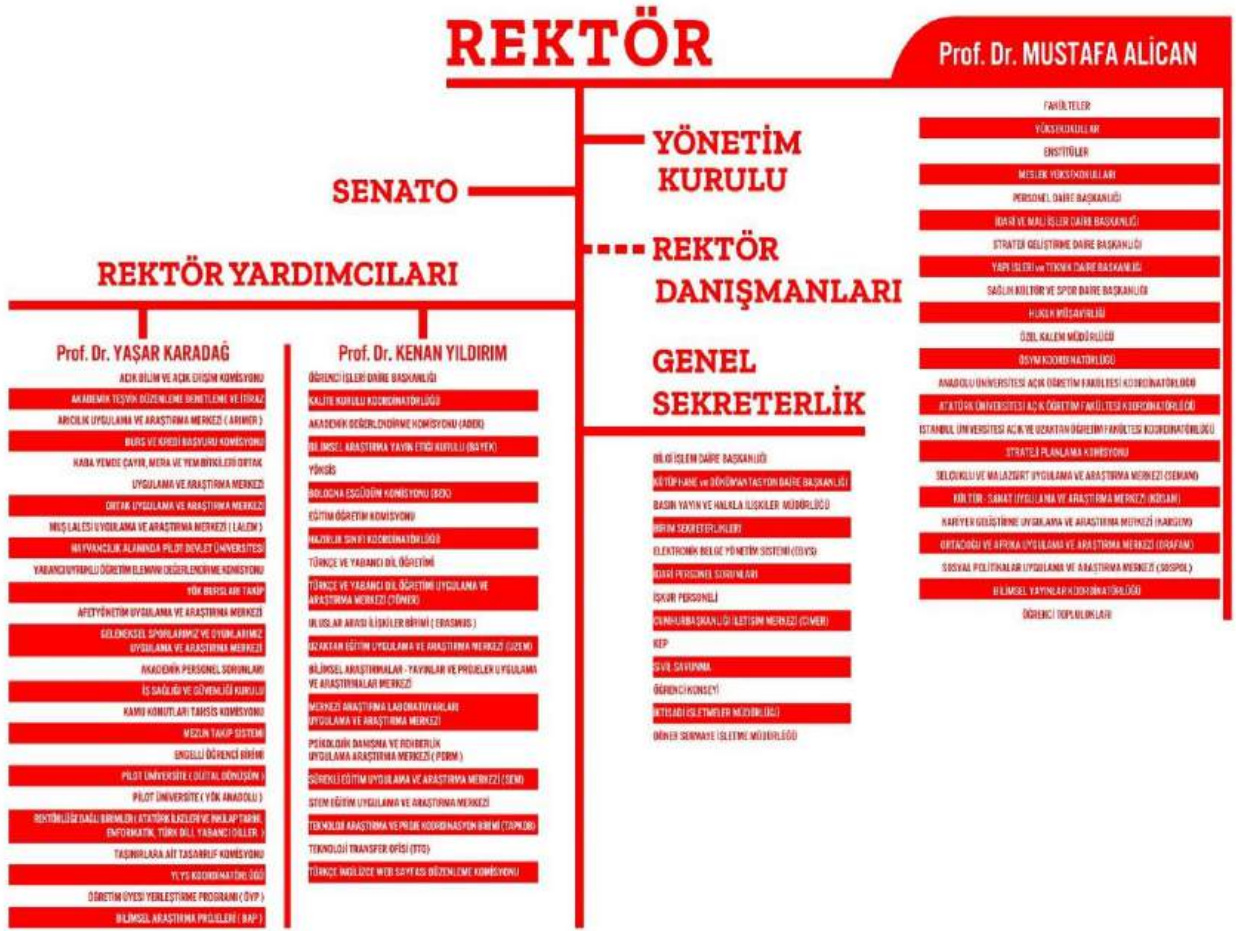
Şekil 1: Üniversite Organizasyon Şeması

Üniversitemiz organizasyon şeması, kurumsal web sayfasında kamuoyu ile paylaşılmaktadır. Muş Alparslan Üniversitesi'nin hiyerarşik yapısını gösteren organizasyon şeması, Şekil 1'de gösterildiği gibidir.